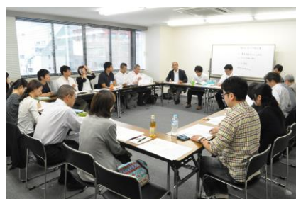
相談員研修の様様（平成26年9月20日）