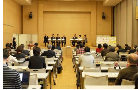
簡単操作の Web システムを利用した最新事例報告会