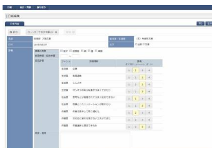
メンタルヘルス支援ソフト当事者入力画面